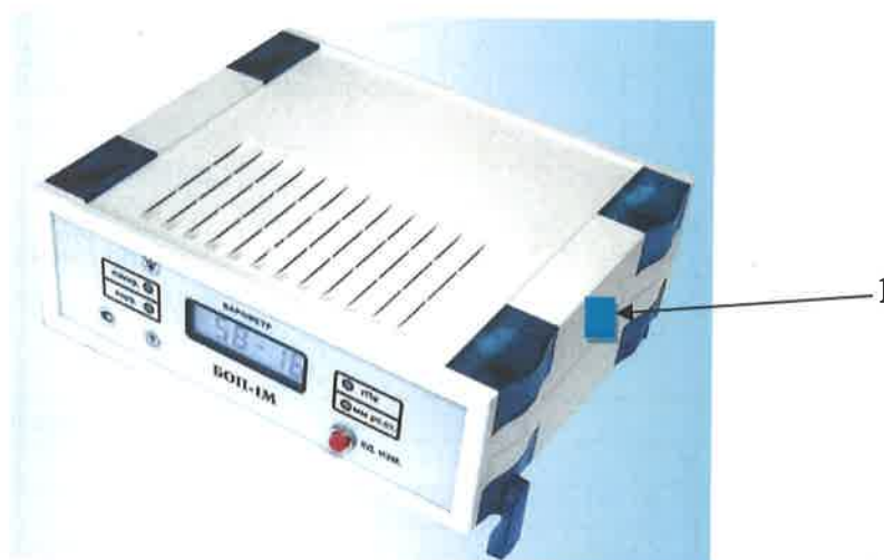
Рисунок 2 - Схема пломбирования стационарных поверочных наборов для средств измерений атмосферного давления СПН-1